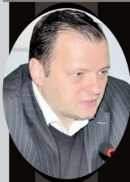
Prefect al Județului Bacău