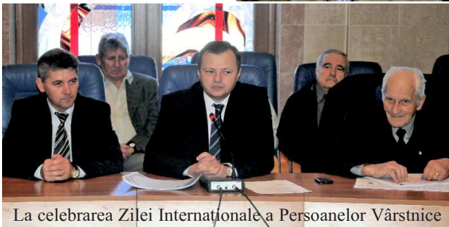
La celebrarea Zilei Internaționale a Persoanelor Vârstnice