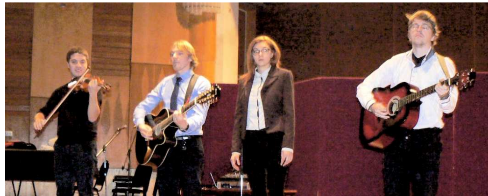
Culturale „Clepsidra” Roman

Am adăugat încă un an dăruit de Dumnezeu - nu știu dacă l-am meritat - în drumul meu către maturizarea creștină în scopul atingerii Empireului divin. Doar așa am putut rămâne în picioare în momente de cumpănă, când barca vieții risca să ia apă și să se scufunde. Dar marele miracol al anului care pleacă s-a produs în luna august, când am devenit pentru a treia oară bunnic. La granița dintre a fi și a avea pot aminti publicarea volumului de critică literară și jurnalism cultural, Dreptul la subiectivitate , apărut la Editura „Rovimed Publishers” din Bacău. Îi va urma o altă carte, De gardă la Avangardă , zămislită în laboratorul de creație al Cenaclului „Avangarda XXII”, păstorit cu bună credință de poetul Victor Munteanu.