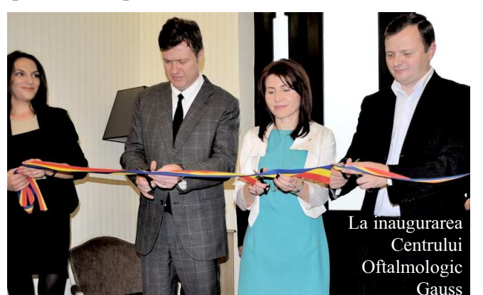
La inaugurarea Centrului Oftalmologic Gauss