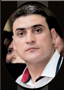
Instructor „Plaiuri Băcăuane”