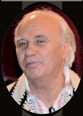
Dirijor „Privighetorile Zeletinului”