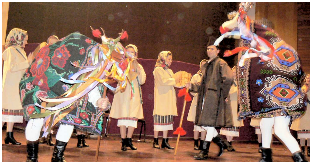
(Urmare din pag. 6)