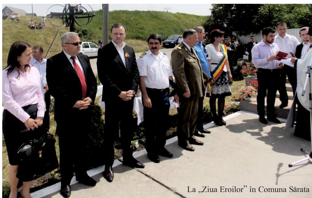
La „Ziua Eroilor” în Comuna Sărata

- Am o părere bună despre tinerii cu cei șapte ani de acasă, instruiți, crescuți în spiritul muncii, al responsabilității, combativi, inventivi, generoși, dornici de cunoaștere. Nu mă refer la cei de bani gata, care își îngroapă zilele prin baruri, în raliuri nocturne cu autoturisme, incapabili de a-și lua destinul în mâini și de a trăi pe propriile picioare. Nu mă refer nici la cei care așteaptă să câștige la loto pentru a-și trăi destinul