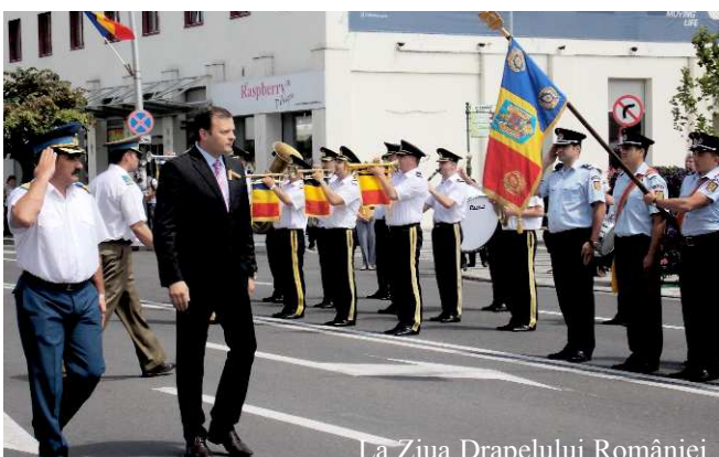
La Ziua Drapelului României