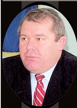
Deputat în Parlamentul României