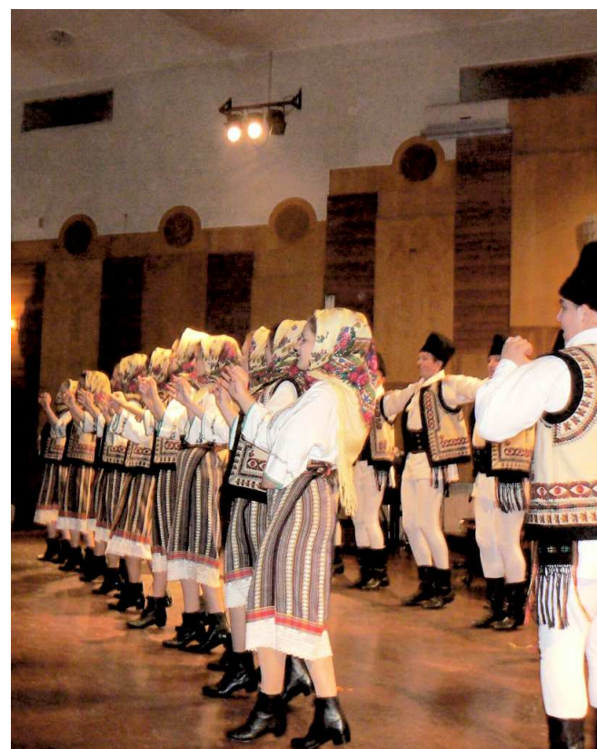
Viața băcăuană • Nr. 470 / decembrie 2014 - ianuarie 2015