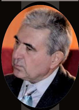
Dirijor Corala „Armonia”

Sâmbătă, 13 decembrie a.c., la Sala „Ateneu” a Filarmonicii „Mihail Jora” din Bacău a avut loc festivitatea de decernare a Premiilor Anuale de Excelență ale Fundației Culturale „Georgeta și Mircea Cancicov” și ale Asociației Culturale „Familia Boierilor Lecca” pentru Promovarea Culturii. Evenimentul a avut loc în cadrul „Crăciunului Scriitorilor” la Avangarda XXII, manifestare de colinde, datini și obiceiuri de Crăciun și Sfântul Vasile cel Mare - Anul Nou 2015.